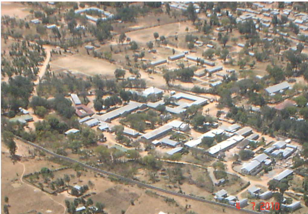
Luchtfoto Makiungu Hospital, Tanzania